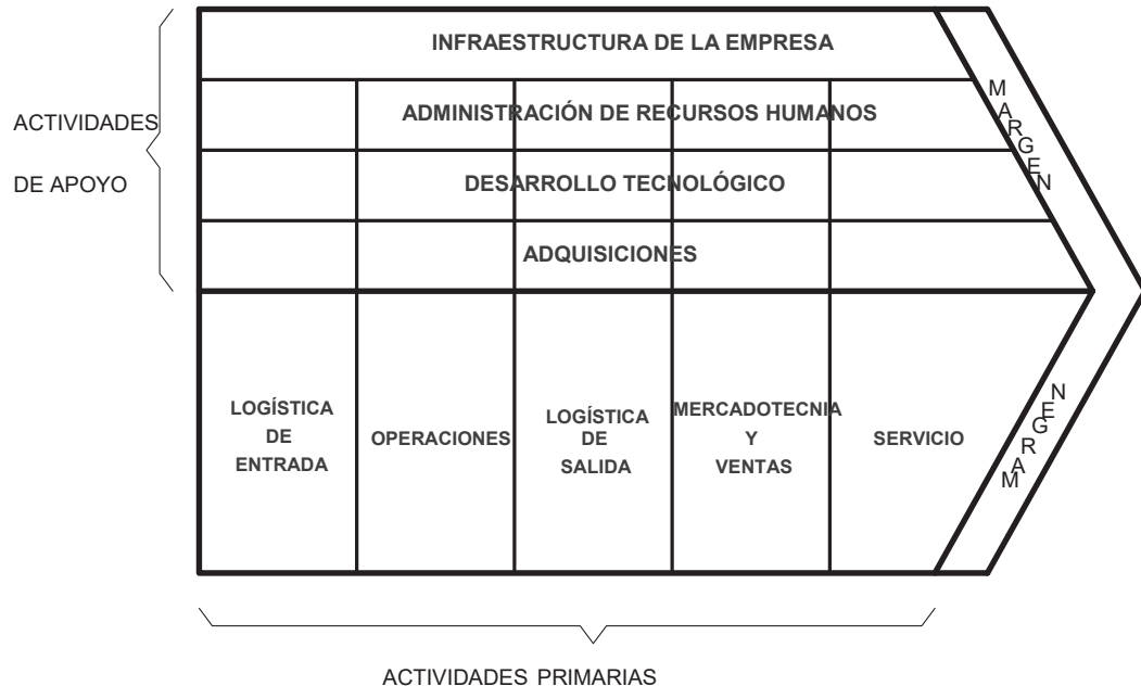
Figura 2- Cadena de Valor Genérica (Porter, 1996, pág. 37)

Las actividades de valor se dividen en dos tipos: actividades primarias y actividades de apoyo.