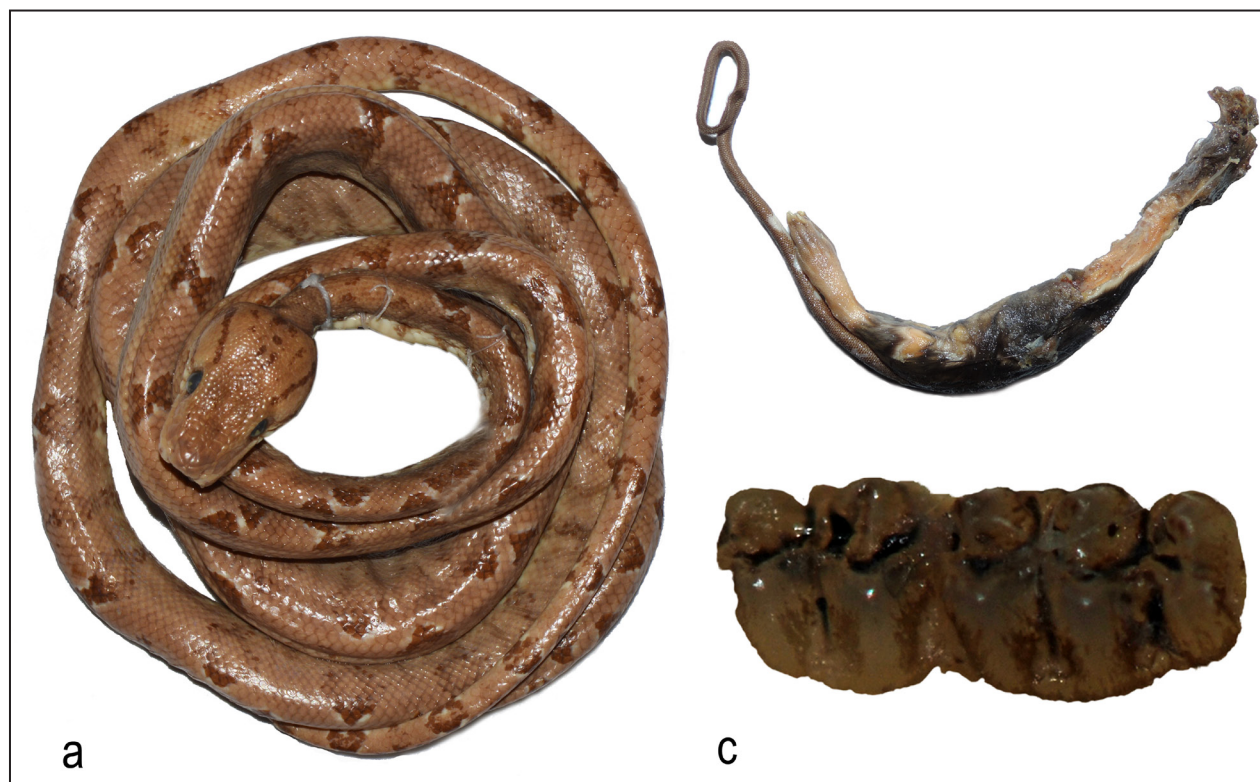
Figura 3. Especimen DHMECN 0014, hembra adulta con contenido estomacal (a); Presa Hylaeamys perenensis (b); Estructuras dentales de Hylaeamys perenensis (c).

hortulanus con menor longitud corporal tienden a depredar aves, mientras que a medida que aumenta su tamaño su dieta se diversifica a mamíferos; sin embargo, información reciente ha reportado la depredación de aves medianas en individuos adultos (Castellari et al. , 2016).