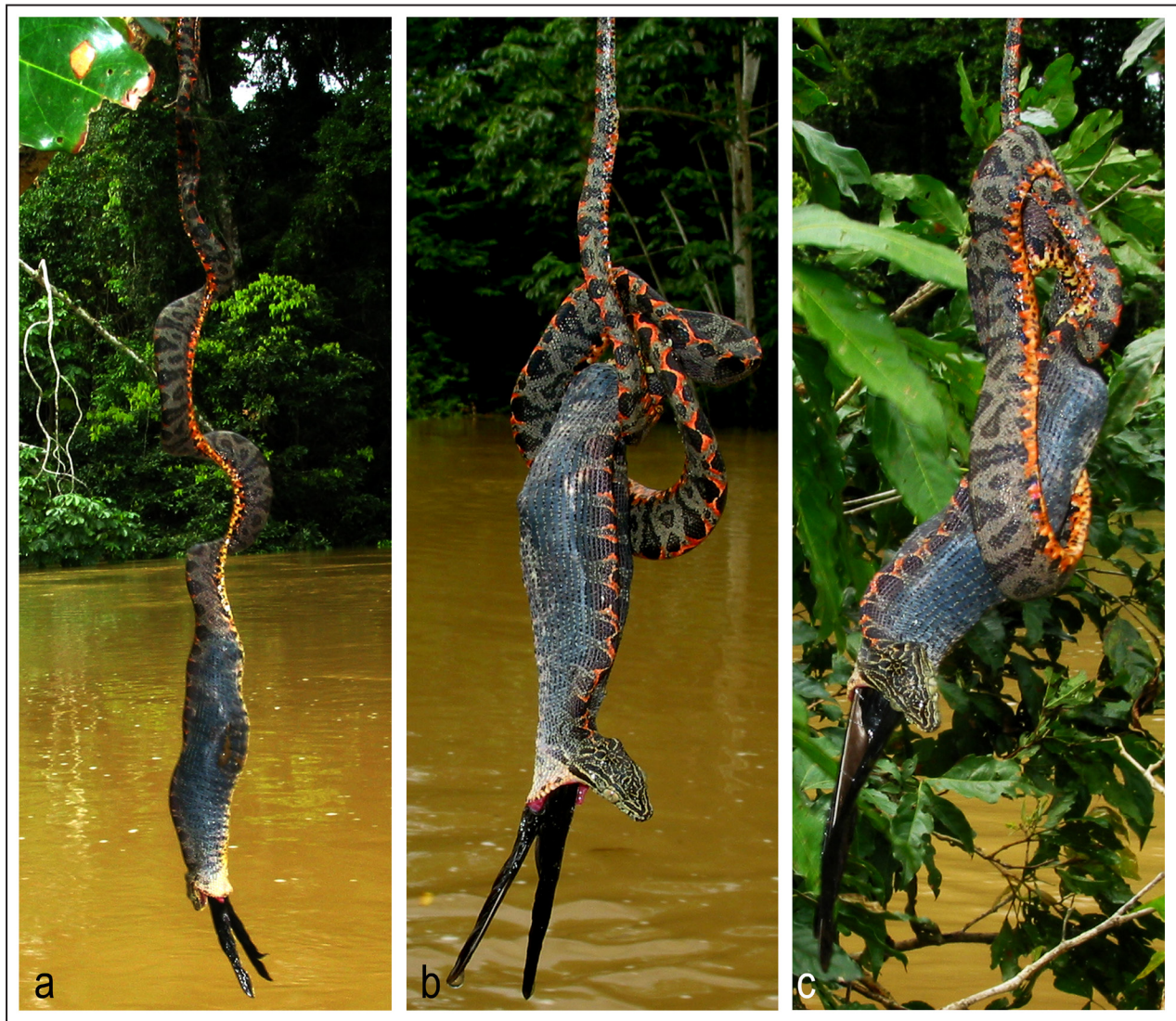
Figura 1. Individuo joven de Corallus hortulanus depredando un ejemplar de Atticora fasciata . Primera fase de ingesta (a) y movimientos de contracción (b y c).

la Estación Científica de la Pontificia Universidad Católica del Ecuador ( 0^{\circ}40'26.12''S-76^{\circ}23'46.37''O ), aguas abajo del río Tiputini, Parque Nacional Yasuní. El avistamiento fue realizado entre las 10:01 y 10:21 am, al borde de vegetación riparia en el río Tiputini, después de un incremento considerable de aproximadamente 10 metros en el cauce del río. El individuo fue observado en una rama con el 90% de su cuerpo elongado, engullendo a un espécimen de Atticora fasciata por la cabeza y avanzando hasta un 75% del total del cuerpo. En el transcurso de la observación, el predador realizó contracciones en su cuerpo para facilitar la ingesta de su presa, estos movimientos contrajeron su cuerpo hasta un 50% de su longitud (Fig. 1).