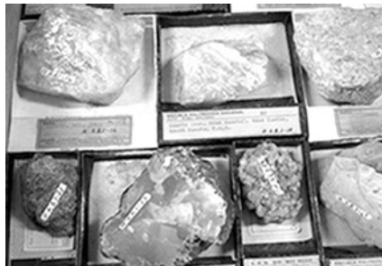
Arriba: Trabajo de prospección en el campo Abajo: Muestras del Museo