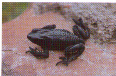
Atelopus ignescens , Hac. Curuvi - Prov. Imbabura