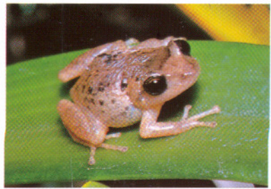
Eleutherodactylus unistrigatus , Lag. Cuicocha - Prov. Imbabura