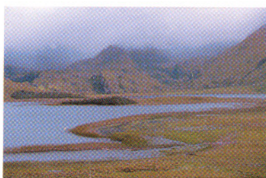
Laguna Atillo, Prov. Chimborazo