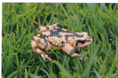
Atelopus pachidermus , Oyacachi - Prov. Napo