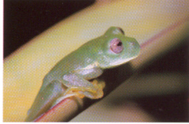
Centrolene buckleyi , Lag. Cuicocha - Prov. Imbabura