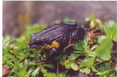
Eleutherodactylus curtipes , Papallacta - Prov. Napo