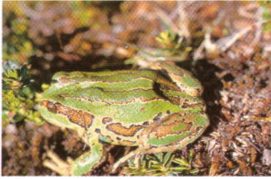
Gastrotheca espeletia , Lag. Verde - Prov. Carchi