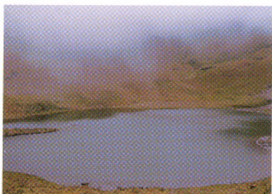
Laguna de Cuyug, Prov. Chimborazo