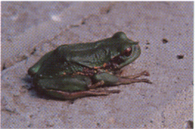
Gastrotheca riobambae , Lag. Cuicocha - Prov. Imbabura