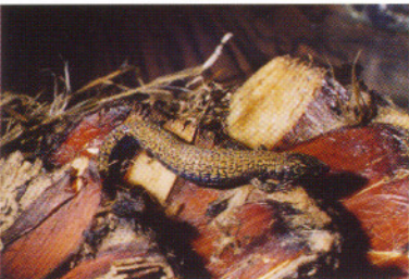
Proctoporus simoterus , Monte Redondo - Prov. Carchi