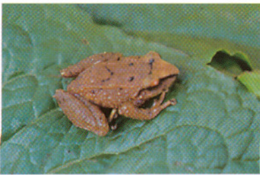
Eleutherodactylus devillei Oyacachi - Prov. Napo