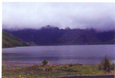
Laguna Grande de Mojanda, Prov. Imbabura