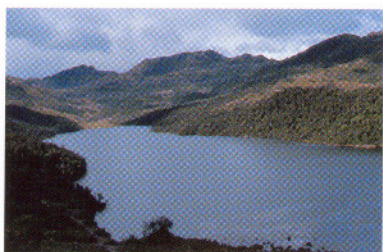
Laguna San Marcos, Prov. Pichincha