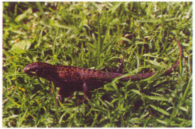
Stenocercus angel , Monte Redondo - Prov. Carchi