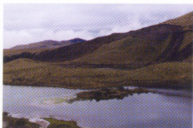
Laguna Verde, Prov. Carchi