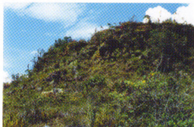
Vegetación Baja, Laguna Cuicocha