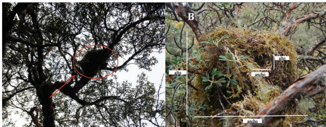
Fig. 2. A= Nido de Thomasomys aureus en un árbol de Polylepis incana , visto desde el suelo; B= nido con medidas principales.

presentaron en promedio las siguientes medidas: Cabeza y cuerpo 90 mm; largo de la cola 120 mm; largo de la pata 29 mm; largo de la oreja 18 mm; peso 25 g. Los nidos tenían las siguientes características y medidas promedio: forma alargada (macho) y circular (hembras), 16.6 cm de longitud, 11 cm ancho, alto 6.6 cm (Tabla.1). Todos los nidos tenían dos entradas, la principal (2-2.5 cm) con dirección norte y la secundaria (1.2-1.8 cm) con dirección sur. Un nido (macho), se encontró a 65 m del sitio de captura, bajo las raíces de Gynoxys sodiroi , el segundo nido (hembra) estaba ubicado a 160 m del sitio de captura, bajo las raíces de Lachemilla orbiculata . El tercer nido (hembra), fue hallado en un frailejón ( Espeletia pycnophyllia ), a 45 m del sitio de captura, entre hojas verdes y secas (Fig. 3 A-B) a 1.5 m de altura.