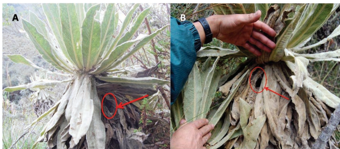
Fig. 3. Nido de Thomasomys paramorum en Espeletia pycnophyllia ; A= entrada anterior; B= entrada posterior.

Los nidos estaban contruidos en su totalidad por material vegetal. Aquellos hallados bajo la superficie fueron elaborados con cortezas de Polylepis incana y Calamagristis intermedia ; en los dos nidos, la cámara interna estaba forrada de diminutas, finas y picadas cortezas de P. incana . Para la construcción del tercer nido el material utilizado en su totalidad fueron hojas masticadas de frailejón ( Espeletia pycnophyllia ). En enero del 2010, el nido de un macho registró una cría (bien desarrollada), con los ojos abiertos y con pelo; su longitud total fue de 110 mm.