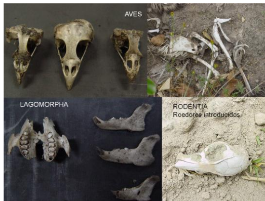
Figura 1. Restos de los vertebrados encontrados en las egagrópilas de la lechuzca de campanario ( Tyto alba ) del sector de estudio.

Entre los mamíferos, el 90,6 % corresponden a los roedores de la familia cricetidae y a algunos roedores introducidos. El 5,3 % corresponden a la especie de conejo silvestre ( Sylvilagus brasiliensis ), y se encontraron también restos de aves que corresponden al 4 % de todos los ejemplares encontrados (Fig. 1).